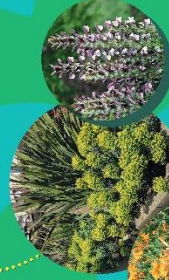
Végétation herbacée d'accompagnement de voirie