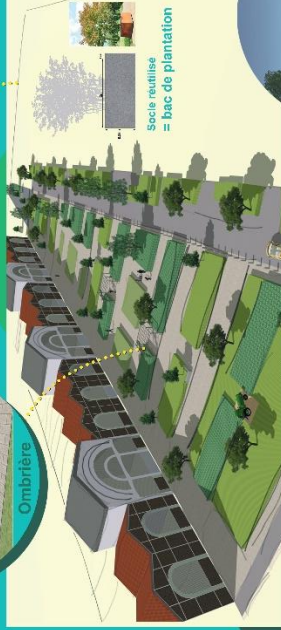
Sechs réutilisés = bacs de plantation