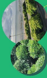
Végétation arbusive d'accompagnement de voirie