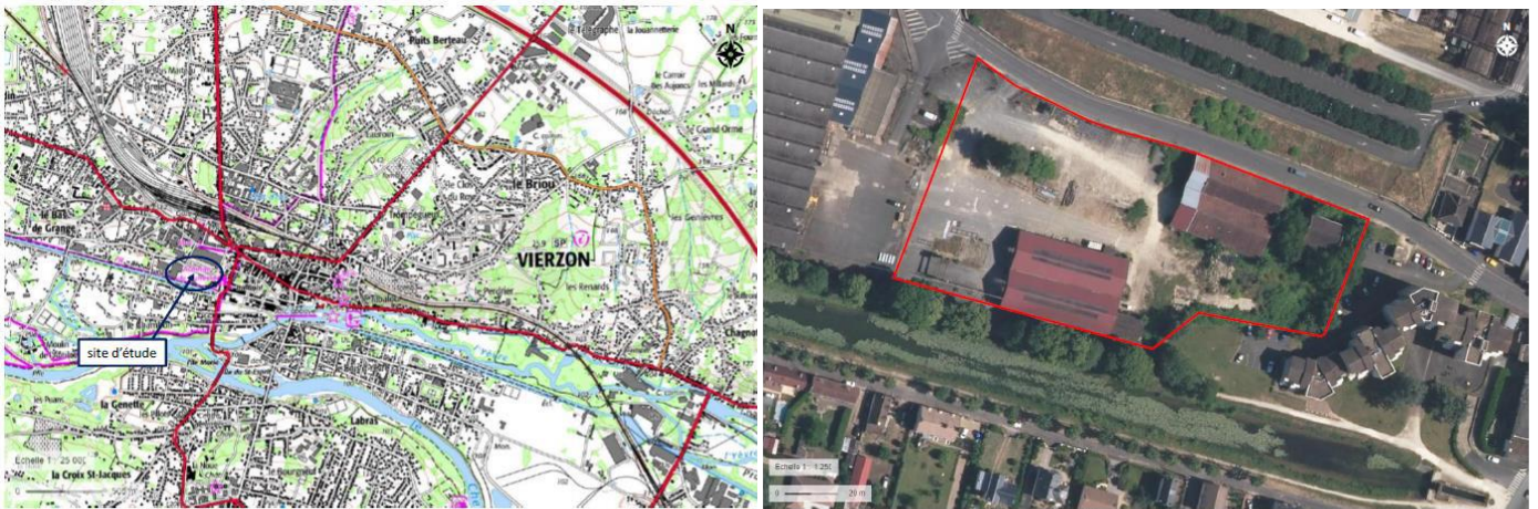
Illustrations 2 et 3 : Localisation du site d'étude à Vierzon

Le secteur est localisé rue du Bas de Grange dans l'enveloppe urbaine de la commune, à proximité du centre ancien. Il est délimité au nord par la rue précitée, à l'est par des habitations, au sud par le canal de Berry et à l'ouest par une chaudronnerie.