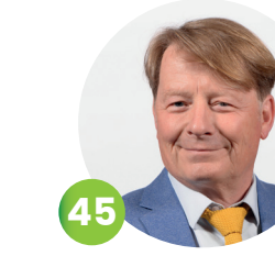
Philippe BULTEAU Maire de Vignoux-sur-Barangeon