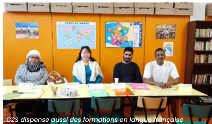
C2S dispense aussi des formations en langue française

Cette régie de territoire accompagne les personnes très éloignées de l'emploi sur Vierzon et les alentours.