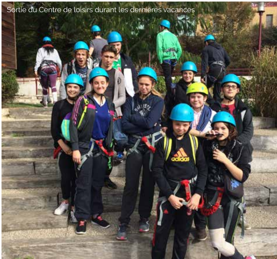
Sortie du Centre de loisirs durant les dernières vacances