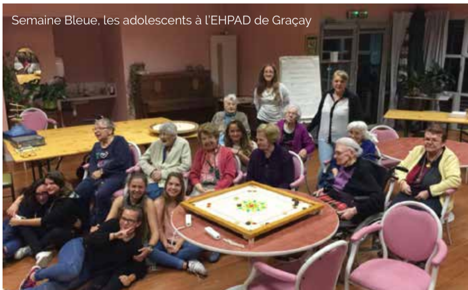
Semaine Bleue, les adolescents à l'EHPAD de Graçay

Pour plus de renseignements : Service Enfance et Jeunesse : Tél : 02 48 52 96 41 / Mail : centre-loisirs-pr@cc-vierzon.fr